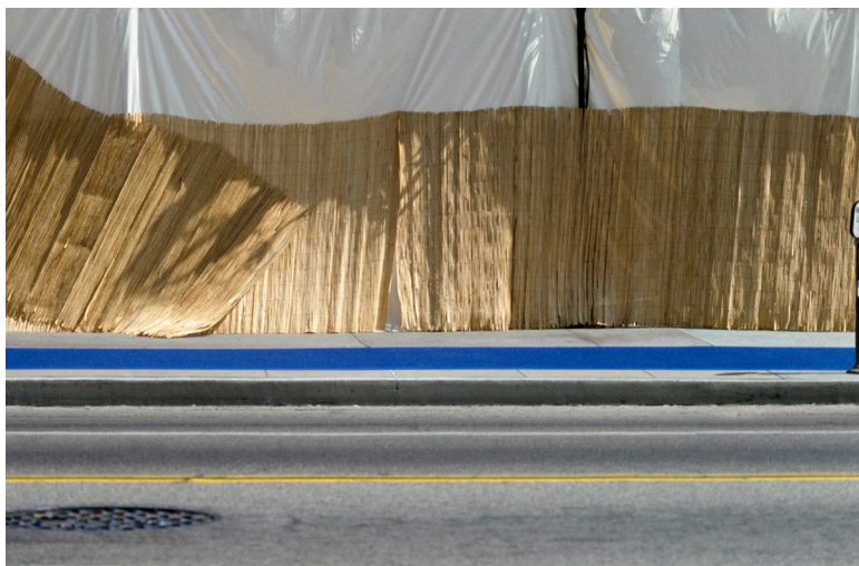
Franco Fontana, Los Angeles , 1979

In questa seconda fotografia ci troviamo invece sul marciapiede di una strada di Los Angeles. Nonostante la scena sia all'apparenza piuttosto banale, poiché quello che stiamo guardando è solo la recinzione esterna di un cantiere, le linee catturate dal fotografo trasformano l'immagine in qualcosa di completamente diverso e interessante, rendendola al pari di una rappresentazione grafica e astratta.