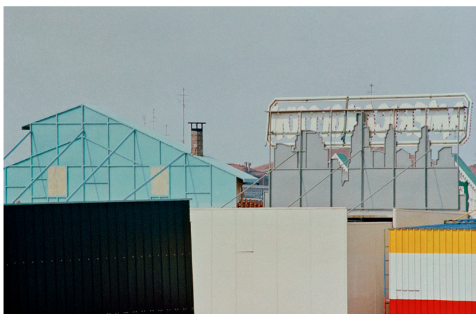
Franco Fontana, Urbano , 1979

La mia è una realtà personale e cerco un'interpretazione che non è illustrativa ma interpretativa, così come lo è la poesia o la musica, che non rappresentano niente ma rappresentano l'esistenza.”